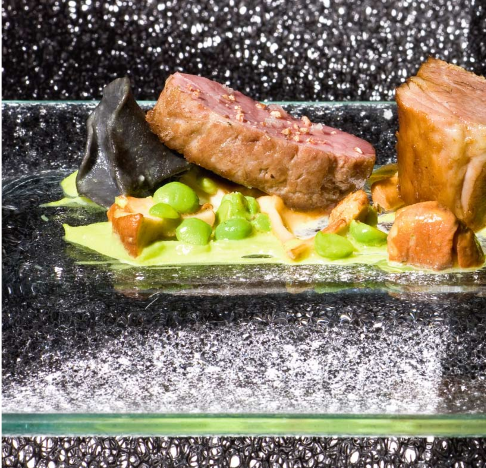
Dreierlei vom Müritz-Lamm mit Erbsen, Pfifferlingen und Sepia-Tortellini